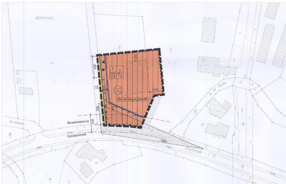
Abb. 2: Bebauungsplan Nr. 33 „Gewerbegebiet Hunteburg Teil II“, 1. Änderung