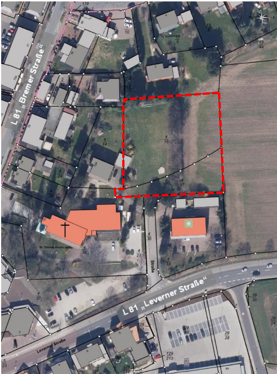
Luftbild und Geltungsbereich ohne Maßstab

Südlich an das Plangebiet schließen die Polizeistation und die St.-Thomas-Kirche an. Die Bereiche westlich und nördlich sind überwiegend durch Wohnbebauung geprägt. Erschlossen wird das Plangebiet von der L 81 „Leverner Straße“ über das Flurstück 4/36.